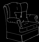
con volant senza ruote