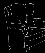
piedi a vista senza ruote