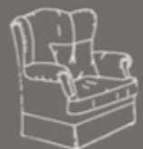
con volant senza ruote