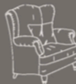
piedi a vista senza ruote